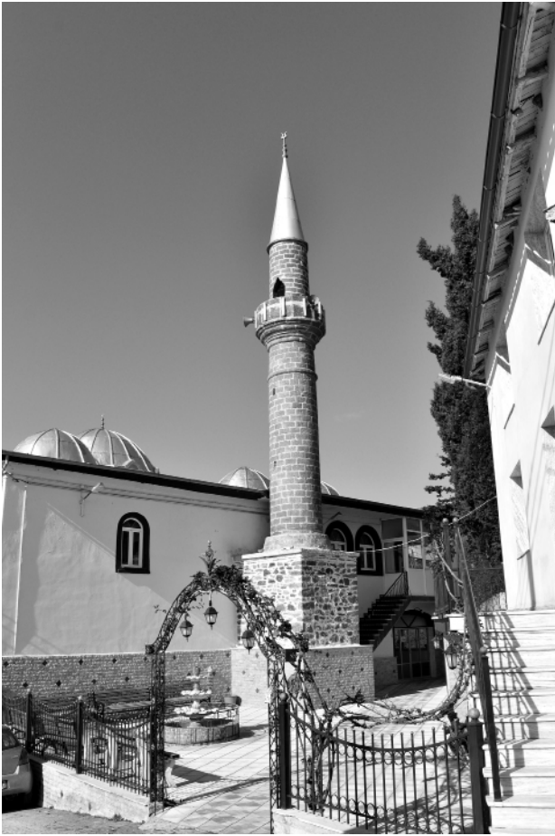
Yassiören Camisi ve mihrabı.

Osmanlı döneminde, H.1246 – M. 1831 tarihinde yapılan sayımda köyün adı “Karye-i Yassıvıran” olarak belirtilmiş ve nüfusu da şöyle kaydedilmiştir: Tuvânâ - Güçlüler: 150 Sabi – Çocuklar: 165