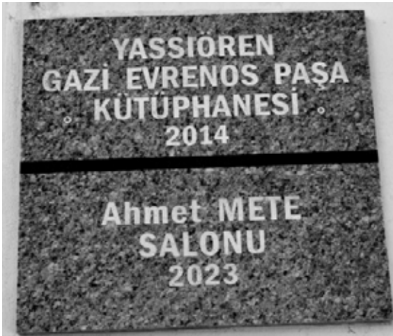
Köyde 2023 yılında Ahmet Mete Salonu ve 2014 yılında da Yassıören Gazi Evrenos Paşa Kütüphanesi hizmete açılmıştır.

1965 öncesi 650 haneli bir köy iken, 5 mahallede, hem ibadet, hem eğitim amaçlı kullanılan cami ve