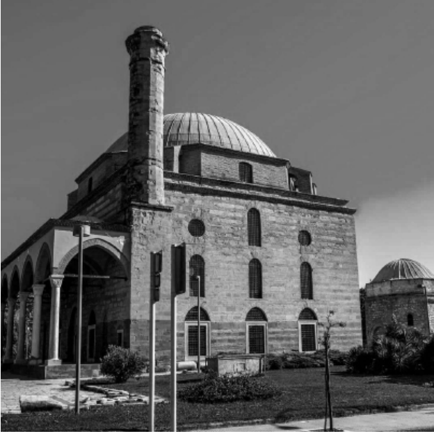
Günümüzde Tırhala'daki Osman Şah Camii.

Sultan Süleyman'dan büyükçe idi. Hatta Selim Şah, Sultan Süleyman'ı katledin diye bostancıbaşı ya teslim ettiğinde bostancıbaşı şehit ettim diye bir adamın cenazesini kılıp Eyyub Sultan civarında