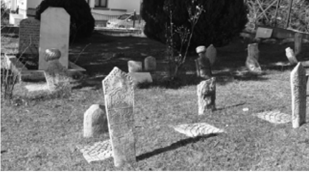
Yassiören Camisi haziresi.

sayıda göç vermiştir. En çok göç verdiği dönem 60 lı ve 70 li yıllardır. Göç sebepleri; işsizlik, Cunta dönemi ile beraber Kıbrıs sorununun getirdiği baskılardır. Yine Cunta döneminde, İskeçe