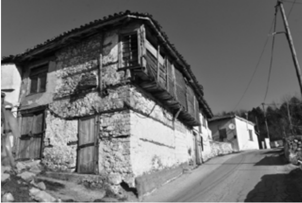
Yassiören'de eski bir ev örneği.

merkezine 19 km ve az virajlı olan toprak yolunu işlevlikten çıkararak başka köylerin de kapsamasını gerekçe göstererek daha zor çok virajlı ve en önemlisi İskeçe merkezine 19 km olan yol 28 kilometrelik yeni toprak yolun yapılması köyün nüfus kaybetmesinin sebeplerinden biridir. Yassiören en çok Türkiye'ye göç vermiştir.