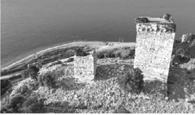
Semadirek Adası'nda, muhtemelen Sarı Saltık'ın fethettiği Paleopolis'teki kale.

-Siz bunı Saltıh dirsiz, bu derd-mend niçe korkusından ditrer, görün. Şol aşağıdan gelen Saltıh ve kendüdür. Bu bir bi-çâre râhibdür, meded eylen, gelüp tutmasunlar, didi. Kafirler eyitdiler: