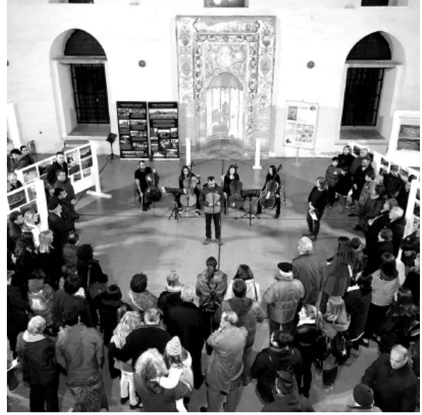
Osman Şah Camii günümüzde konser salonu olarak kullanılmaktadır.