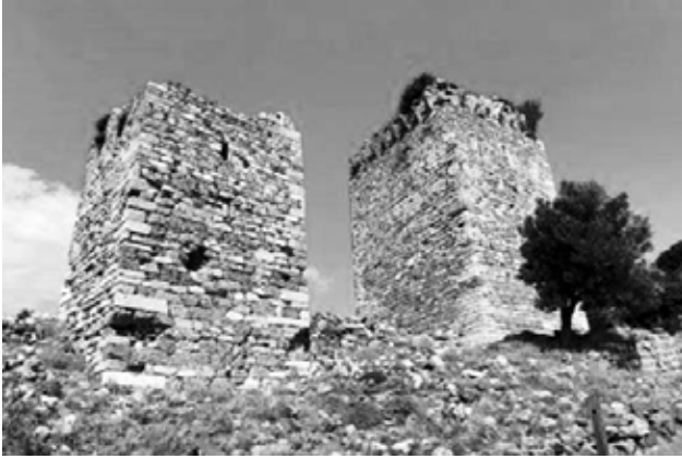
Semadirek Adası'nda, muhtemelen Sarı Saltık'ın fethettiği Paleopolis'teki kale.

Server ol deniz içindeki tağı göricek gemiyi ana