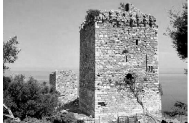
Semadirek Adası'nda, muhtemelen Sarı Saltık'ın fethettiği Paleopolis'teki kale.

-Bunı bizden ön gelen hakimlerden kimesneler tılsım eylemişlerdür. Bu sada yilden belirür. San' atla