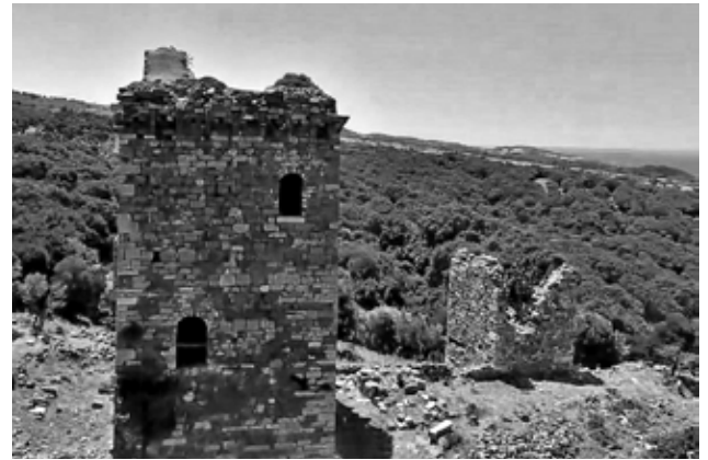
Semadirek Adası'nda, muhtemelen Sarı Saltık'ın fethettiği Paleopolis'teki kale.

-Bu gelenler kimlerdür? Server bakup feryâd ü