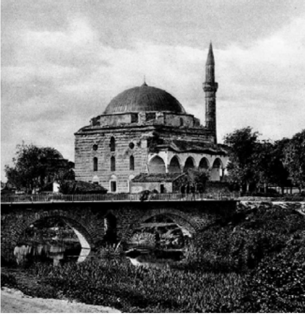
Eski bir fotoğrafta Tırhala'daki Osman Şah Camii

T oplam 23 adet Müslüman mabedi vardır. Evvelâ bunlardan Osmanlı sultanları soyundan 8 adet Cuma camiinin seçkini, mükemmel ve mükellefi Osman Şah Camii'dir ki bir diyarda benzeri yoktur, ancak Tire, Manisa, Bursa ve İstanbul'da vardır. Gerçi küçüktür ama gayet